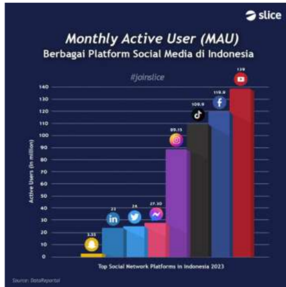
Gambar 4.1 jumlah populasi pengguna