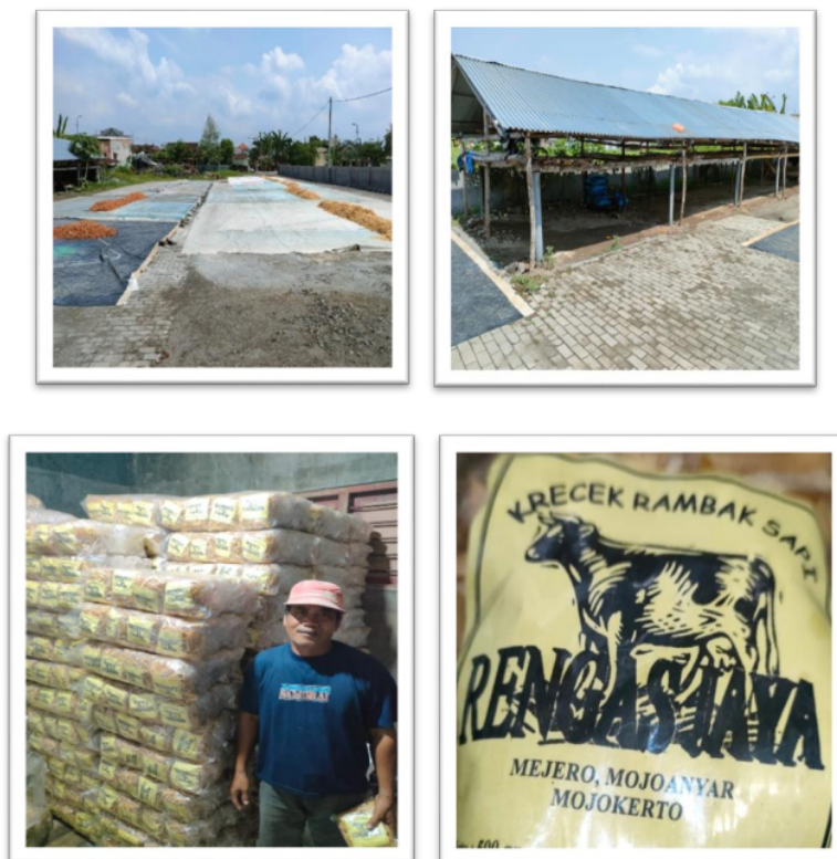
Gambar 1 : Proses Produksi dan Pengelola Krecek Rambak UMKM Rengas Jaya

Adapun yang menjadi sasaran dalam kegiatan pengabdian ini adalah pengelola dengan UMKM Krecek Rambak “UD Rengas Jaya” Mojoanyar Kabupaten Mojokerto. Dimana Sasaran hasil kegiatan yang di harapkan adalah :