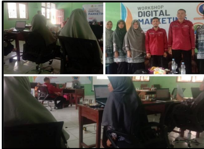
Gambar 2. Pelaksanaan Kegiatan Pelatihan

Kegiatan pelatihan berjalan dengan lancar dan peserta dapat mengikuti tahap- tahap pelatihan. Untuk mengetahui tingkat pemahaman dan keberhasilan pelatihan, peserta dibagi kuioner pertanyaan tingkat pemahaman teori dan praktek kegiatan pelatihan digital marketing. Sebanyak 15 perta pelatihan mengisi kuesioner. Berikut adalah grafik hasil kuesioner peserta : Berdasarkan hasil kuesioner diperoleh hasil diperoleh grafik seperti dibawah ini