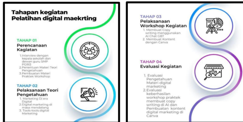
Gambar 1. Metode Pelaksanaan Pelatihan

Pelaksanaan kegiatan pelatihan guru SMP PGRI 3 Baturaja menggunakan 4 tahapan yaitu persiapan, pemahaman materi digital marketing, workshop praktek digital marketing, serta evaluasi pemahaman materi dan keberhasilan workshop praktek kegiatan.