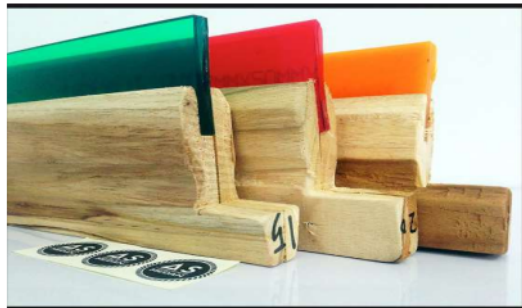
Gambar 4 Rakel

Rakel adalah alat penting dalam proses sablon manual yang digunakan untuk menyebarkan tinta sablon secara merata di atas bingkai sablon. Rakel terbuat dari kayu atau plastik dengan ujung karet yang halus untuk memastikan tinta dapat diaplikasikan dengan tekanan yang konsisten.