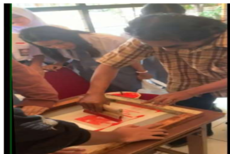
Gambar 14. Proses Penyablonan dengan Siswa/i SMA

Sablon adalah kegiatan mencetak suatu objek dalam bentuk gambar maupun tulisan menggunakan screen di permukaan datar. Ada banyak media yang bisa digunakan, mulai dari kain, aluminium, plastic dan besi. Namun, yang biasa digunakan adalah kain, karena memiliki daya serap yang tinggi dibanding benda lainnya.