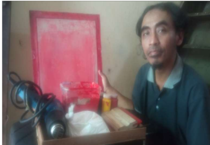
Gambar 11. Penyiapan Bahan Dan Media Sablon