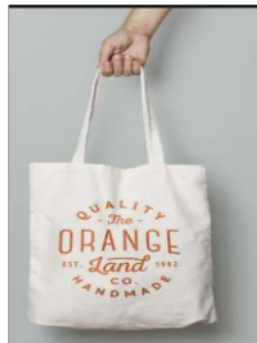
Gambar 13. Kantong Tote Bag