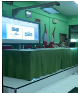
Gambar 2. Ruang Kelas SMA

Selanjutnya presentasi kepada pihak SMA 3 yaitu suatu proses penyampaian ide produk baru atau hasil pekerjaan yang ditampilkan dan dijelaskan terhadap para audiens. Kegiatan presentasi ini, dilakukan pada beberapa acara formal dan non formal untuk menyampaikan informasi secara visual.