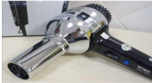
Gambar 6. Hair Drye

Hair Dyer atau disebut juga Pengering digunakan untuk mengeringkan tinta sablon pada material setelah proses sablon. Pengeringan yang benar sangat penting untuk memastikan bahwa tinta sablon tidak luntur dan desain sablon bertahan lama.