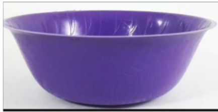
Gambar 7. Mangkok