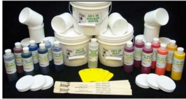
Gambar 12. Tinta Sablon