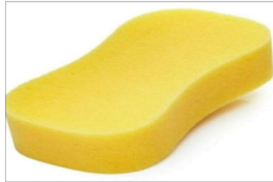
Gambar 5 Spon Busa

Spon abrasif merupakan spons tipis yang teksturnya sangat kasar biasanya, spons abrasif ini dijual dengan warna hijau tua secara lembaran. Karena teksturnya yang sangat kasar, spons abrasif ampuh. Spon busa ini untuk membuka bagian area desain yang terkena obat afdruk. Kemudian setelah dengan menggunakan spon maka terakhir menggunakan air dengan alat spray supaya desain yang terbuka bersih untuk di sablon.