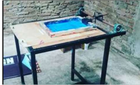
Gambar 3 Outdoor SMA

Meja sablon adalah permukaan kerja utama dalam proses sablon manual. Meja ini dirancang untuk memegang bingkai sablon dengan stabil, memastikan bahwa kain atau material sablon lainnya tetap datar dan tidak bergeser selama proses sablon. Beberapa meja sablon dilengkapi dengan sistem pemanas untuk mempercepat pengeringan tinta.