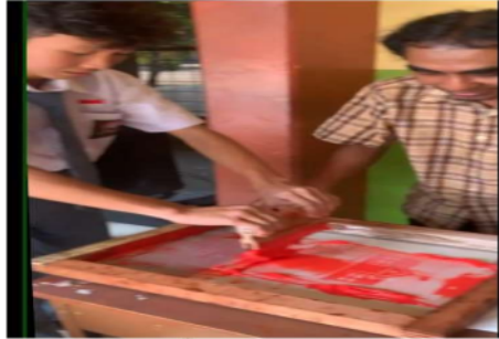
Gambar 15. Proses Penyablonan dengan Siswa/i SMA