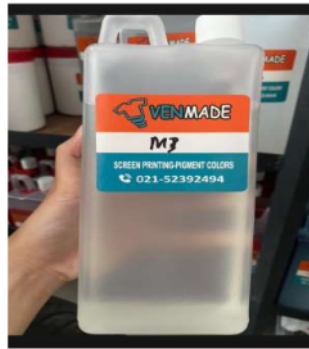
Gambar 16. Cairan M3

Setelah proses sablon selesai, alat pembersih seperti spatula, cairan pembersih khusus, dan air digunakan untuk membersihkan bingkai sablon, rakel, dan alat lainnya dari sisa tinta. Kebersihan alat sablon adalah kunci untuk mempertahankan kualitas sablon dan menghindari masalah dalam produksi berikutnya. Memahami fungsi dan cara kerja dari setiap alat dalam sablon manual adalah langkah awal yang penting bagi siapa saja yang ingin menguasai teknik sablon manual. Dengan alat yang tepat dan keterampilan yang terasah, sablon manual bisa menghasilkan produk sablon berkualitas tinggi dengan sentuhan personal yang kuat.