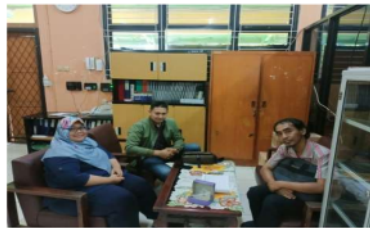
Gambar 1. SMA Negeri Dan Ruang Guru

11 Metode eksplorasi merupakan aliran pembelajaran yang menjadikan siswa sebagai pusat yang akan meletakkan siswa sebagai subjek yang melakukan proses pemahaman. Dengan pengertian metode diatas nantinya akan kami terapkan penyampaianya ke siswa/i di sekolah SMA sehingga mereka dalam pemahaman praktika teknik sablonnya mengerti prosesnya. Observasi. yang kami lakukan pertama adalah bertemu dengan pihak SMA dan diskusi mengenai pelaksanaan PPM nantinya.