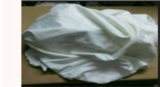
Gambar 17. Kain Lap