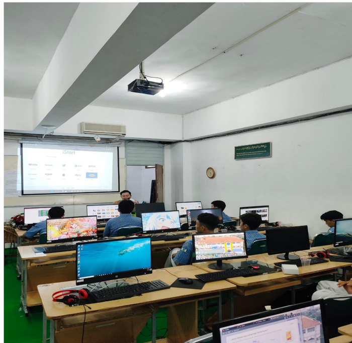
Gambar 2. Peserta Mengikuti Kegiatan Pelatihan Canva

Kegiatan Pengabdian kepada Masyarakat telah dilaksanakan pada hari Rabu 10 Mei 2023 yang dilaksanakan secara luring di Labotarium pukul 09.00 - 11.30 WIB SMA Muhammadiyah 01 Surakarta dengan protokol ketat. Pelatihan ini diikuti oleh lebih dari 30 peserta dari Siswa SMA Muhammadiyah 01 Surakarta Dalam pelatihan ini, Rahmad Ardhani, S.Kom, M.Kom selaku dosen Prodi Sistem dan Teknologi Informasi Universitas ‘Asyiyah Surakarta memberikan materi tentang pengertian digital marketing, Penggunaan Tools Canva dan Cara mendesain yang menarik . Selain itu, para peserta juga diberikan kesempatan untuk mempraktekkan Cara mendesain dengan Canva.