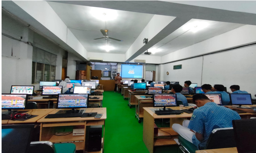
Gambar 3. Peserta Mengikuti Kegiatan Pelatihan Canva

Di sesi ke-2 Para siswa dan siswi secara aktif mempraktikkan materi yang sudah diberikan. Untuk menguji kemampuan tentang keahlian mendesain canva dengan mendesain sebuah desain promosi yang di pandu oleh pemateri.