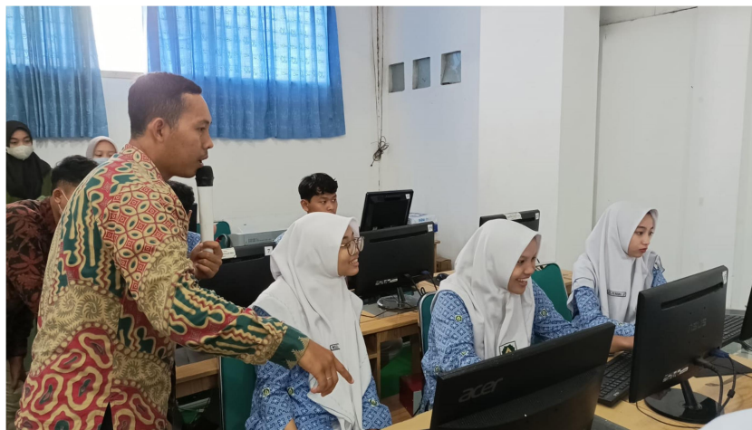
Gambar 3. Peserta praktek desain Canva

Di sesi ke-2 Para siswa dan siswi secara aktif mempraktikkan materi yang sudah diberikan. Untuk menguji kemampuan tentang keahlian mendesain canva dengan mendesain sebuah desain promosi yang di pandu oleh pemateri.