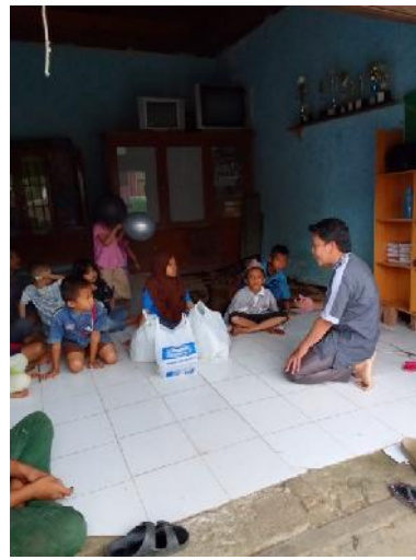
Gambar 3. Proses Sosialisasi

Berdasarkan hasil kegiatan ketahui bahwa setelah dilakukan kegiatan sosialisasi motivasi dan literasi anak-anak panti asuhan ananda mengalami peningkatan. Hal ini ditunjukkan dari antusiasnya anak-anak panti asuhan ananda dalam mengikuti kegiatan dan setelah pelaksanaan kegiatan.