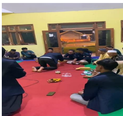
Gambar 3 Pemberian Apresiasi Kepada Masyarakat Yang Bertanya