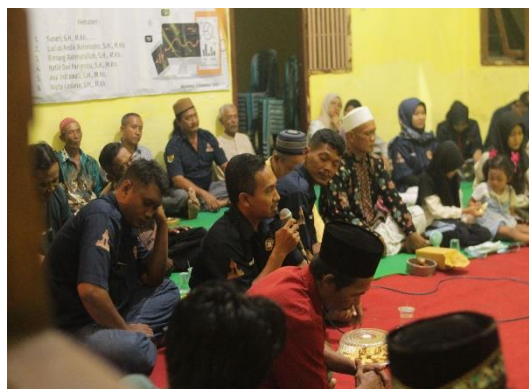
Gambar 2 Kegiatan Diskusi Terbuka Bersama Masyarakat