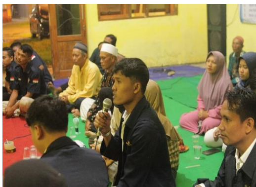
Gambar 2 Mahasiswa Sedang Menjelaskan Materi