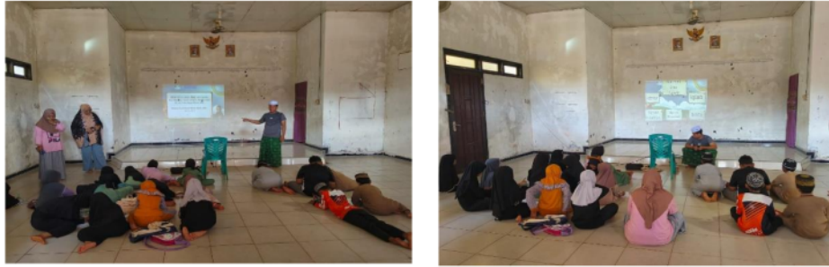
Gambar 2. Implementasi Pembelajaran Tajwid