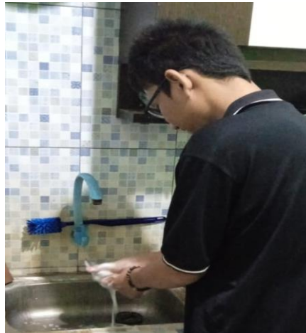
Gambar 2. Diferensiasi Proses.

Yaitu cara siswa memproses gagasan dan informasi. Bagaimana siswa berhubungan dengan bahan pembelajaran serta bagaimana hubungan itu menjadi faktor penentu opsi belajar siswa. Ada banyak perbedaan dalam cara dan opsi belajar siswa, sehingga kelas harus disesuaikan agar lebih dapat mengakomodasi kebutuhan belajar siswa yang berbeda.